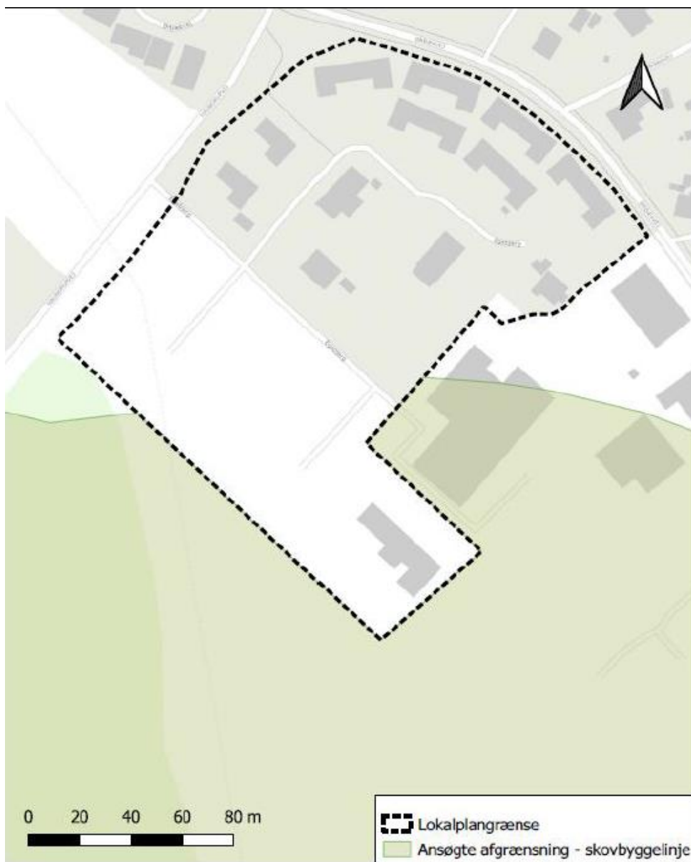
Kort bilagt kommunens ansøgning