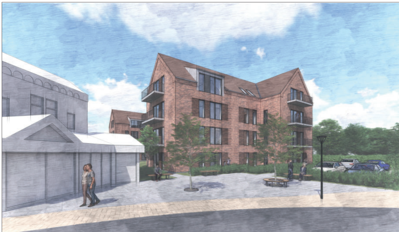
Visualisering som viser et eksempel på, hvordan ny bebyggelse i 3½ etager kan se ud mod Centrumpladsen.