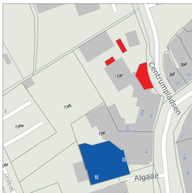
Kort over registreret jordforurening (Blåt V1, Rødt V2)

Der er inden for lokalplanens område registreret arealer med kendt jordforurening som V2 (vidensniveau 2). Regionerne kortlægger areal på V2, hvis der er tilstrækkelig dokumentation for, at der er forurening i jorden, som kan have skadelig virkning på mennesker og miljø.