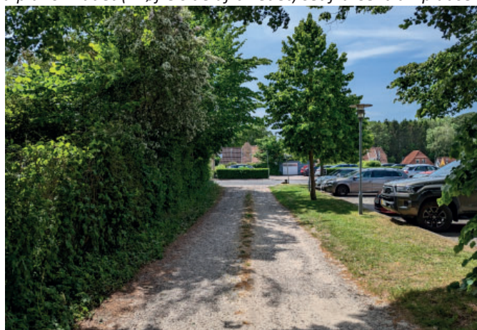
Grusvej mod Lindevej