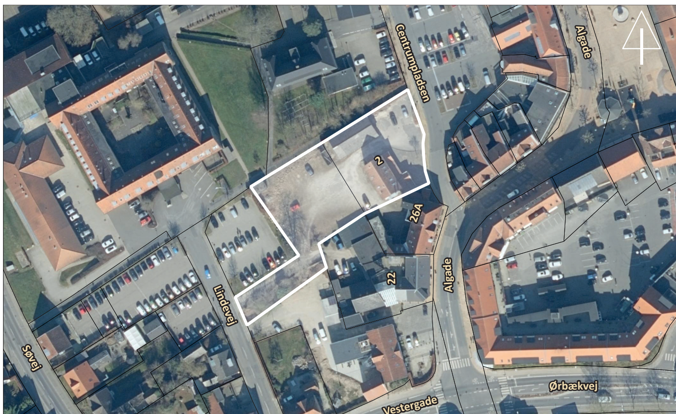
Lokalplanområde markeret med en hvid streg

Bymidtens bebyggelse fremstår med en god blanding af referencer til tidligere tiders arkitektur. Bymidtens bebyggelse er især udviklet i perioden fra 1850 til begyndelsen af 1900-tallet. Tidens byggeri var her i høj grad præget af historicistisk byggestil som også byens stationsbygning er defineret af. Stilen dominerer især bymidtens to hovedgader: Algade og Jernbanegade. Byens ældste bygninger er desuden præget af senklassicisme, der repræsenterer en overgang fra klassicisme til historicisme.