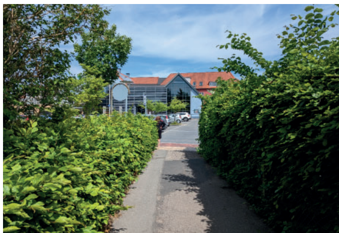
Stien nord for lokalplanområdet med biblioteket i baggrunden.