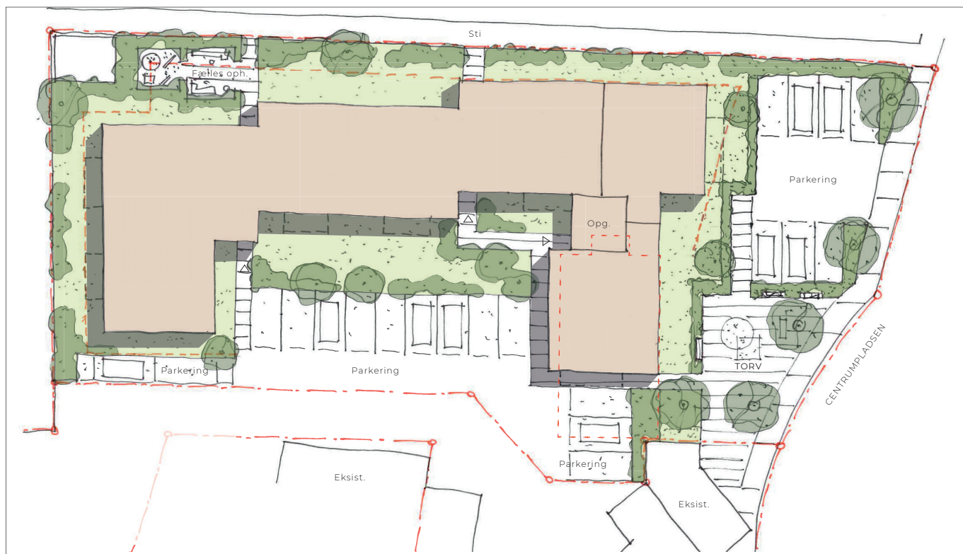
Illustrationsplan som viser et eksempel på, hvordan området kan disponeres.

Lokalplanen tillader en bebyggelsesprocent på 150.