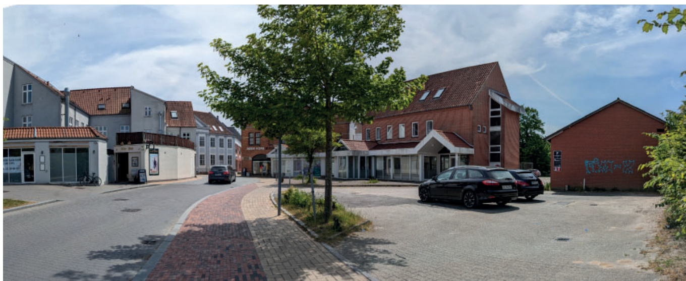
Lokalplanområdet (i højre side af billedet) set fra Centrumpladsen

Ringe Station og Svendborgbanen ligger mindre end 400 m nordøst for lokalplanområdet. Fra Ørbækvej knap 120 m fra lokalplanområdet er det muligt at stå på bussen til blandt andet Ryslinge, Nr. Lyndelse, Kerteminde og Faaborg.