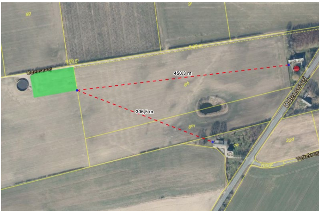
Projektområdet for pilotanlægget markeret med grøn firkant, målsat med afstanden til hhv. bebyggelse på Odensevej 229, samt nærmeste nabo, Odensevej 252.