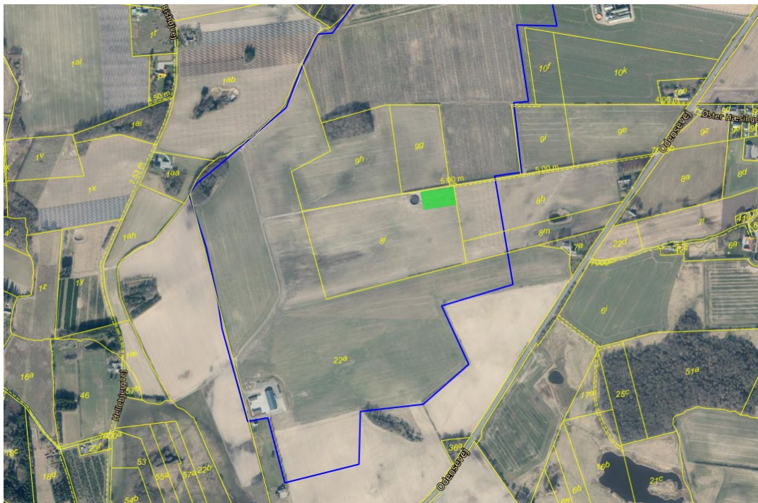
Projektområdet for pilotanlægget markeret med grøn firkant. Den blå linje angiver den sydlige afgrænsning af projektområdet for det store solcelleanlæg.