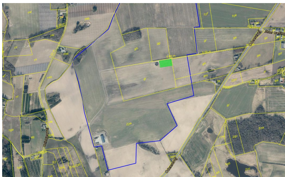
Projektområdet for pilotanlægget markeret med grøn firkant. Den blå linje angiver den sydlige afgrænsning af projektområdet for det store solcelleanlæg.

Solcelleanlægget placeres på del af matr. 8i, Ø. Hæsinge By, Ø. Hæsinge, tilhørende Odensevej 229, 5600 Faaborg. Matriklen udgør i alt ca. 9,6 ha. Anlægget placeres uden tilknytning til anden bebyggelse, udover gylletanken, men netop placeringen, indenfor det fremtidige store anlæg er vigtig for at sikre brugbare driftsdata.