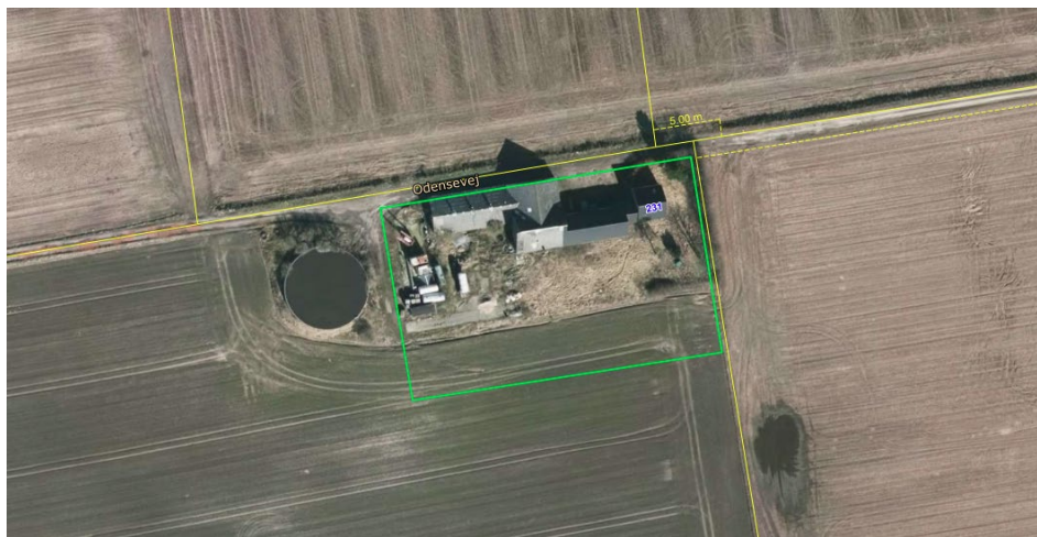
Den tidligere bebyggelse, Odensevej 233, nedrevet i 2018. Grøn afgrænsning markerer projektområdet for forsøgsanlægget.

Samtidig giver placeringen mulighed for at udnytte eventuelle tekniske installationer fra den tidligere bebyggelse, der blev nedrevet i 2018.