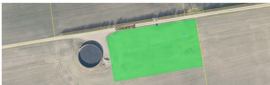
Dige angivet med orange streg, 7 meter nord for projektområde for forsøgsanlægget, markeret med grønt.

Umiddelbart nord for projektområdet – langs adgangsvejen - er der registreret et beskyttet dige. Da solcelleanlægget opsættes på modsatte side af vejen, vurderes det at sagen ikke har betydning for dette. Der gøres opmærksomt på at der ikke må ændres på tilstanden af det beskyttede dige, men skal bevares i sin nuværende stand.