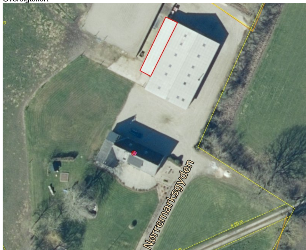
Bygning markeret med rød