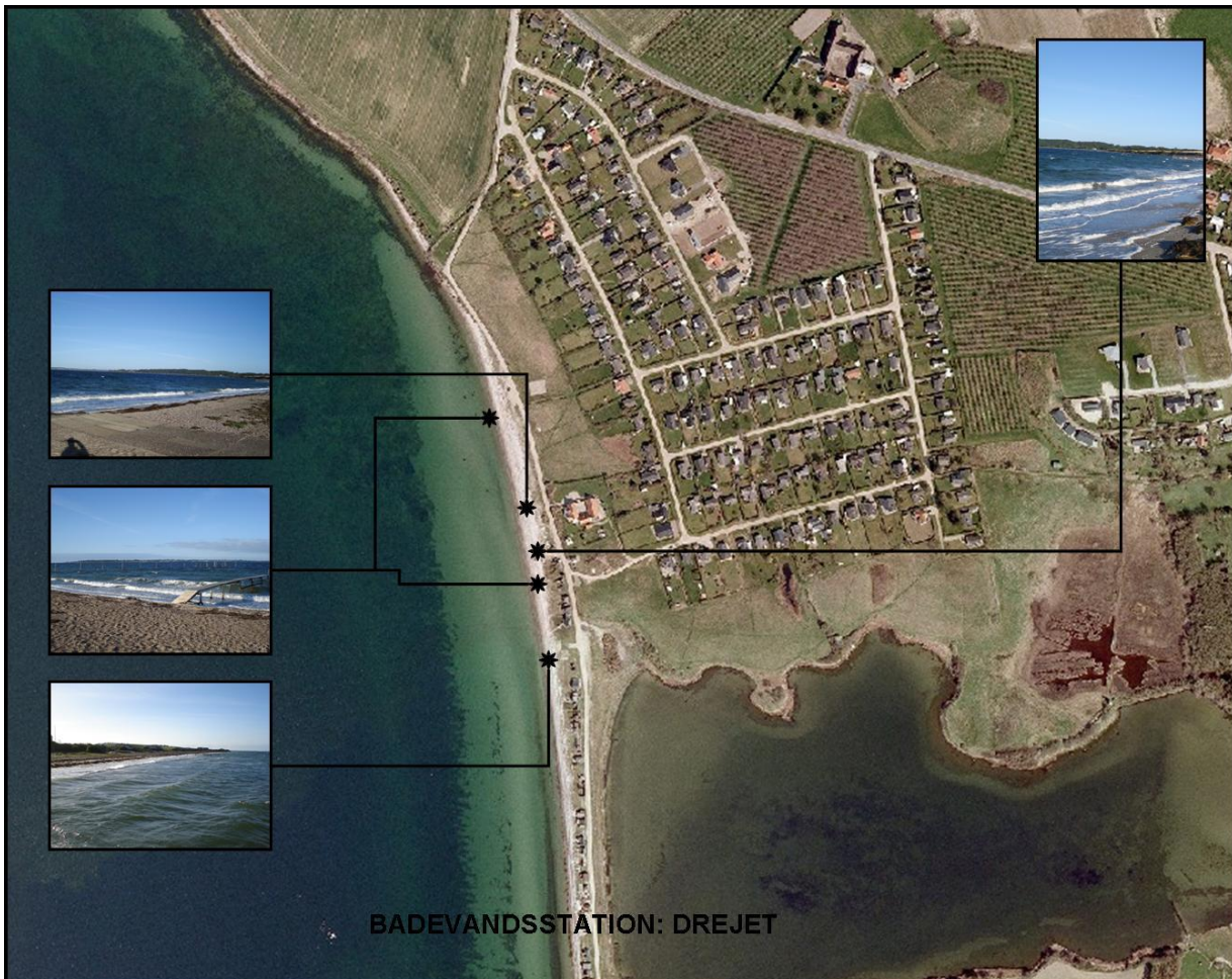
Figur 1. Badstedets placering med billeder taget på badestedet i september 2010.