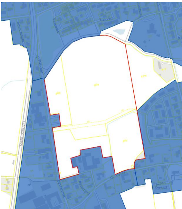
Figur 1: Kloakopland SDR007 og SDR011 ved Gl. Byvej før ændringen af spildevandsplanen. Området er markeret med rødt.

Området er ikke optaget i spildevandsplanen 1 på nuværende tidspunkt og ligger mellem kloakopland SDR007 og SDR011 (Figur 1).