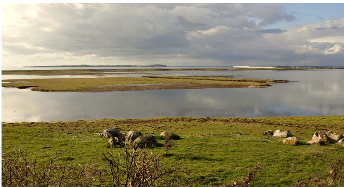
Udsigt over fugleø Noret