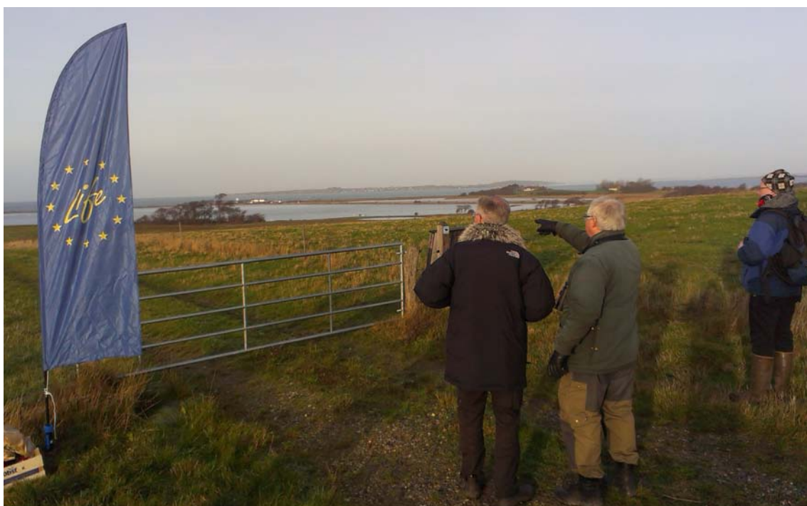
Besigtigelse af projektområde i forbindelse med LIFE projekt

Den kommunale Natura 2000-handleplan er som udgangspunkt omfattet af krav om miljøvurdering i henhold til lov om miljøvurdering af planer og programmer (Lovbekendtgørelse nr. 1533 af 10/12/2015). For samtlige statslige Natura 2000-planer er der foretaget en strategisk miljøvurdering. Natura 2000-handleplanen har et indhold, der ikke adskiller sig fra de oplysninger, som allerede er givet i de miljøvurderede naturplaner. Da Natura 2000-handleplanen ikke sætter nye rammer for fremtidige anlægstilladelser eller yderligere vil kunne påvirke internationalt udpegede naturbeskyttelsesområder væsentligt, er planen ikke omfattet af lov om miljøvurdering af planer og programmer.