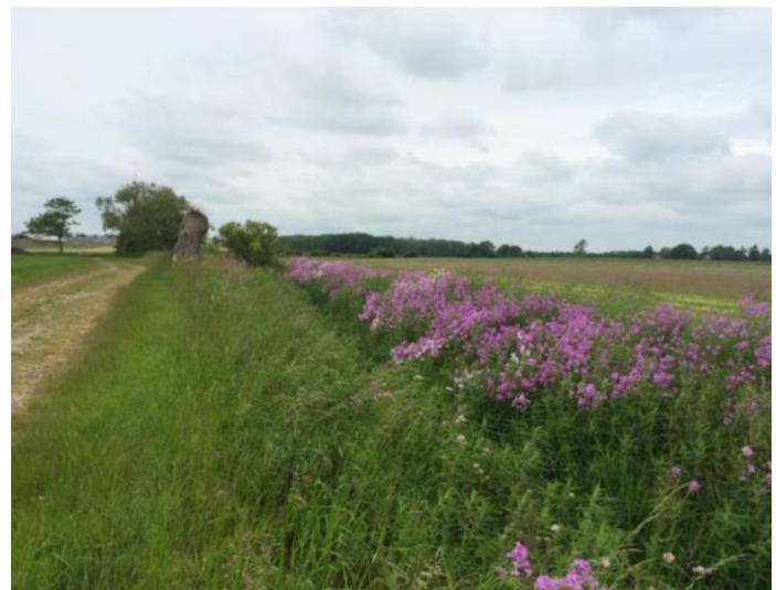
Figur 1 Pederstrup Bæk set fra ca. st.1.340m og i nedstrøms retning

Stine Bundgaard Hansen Dir. tlf. 7253 2007 mail: sthan@fmk.dk