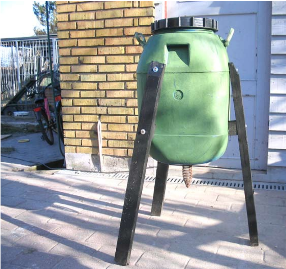
Foderautomat med spiral, der sørger for, at rotter ikke så let har adgang til foderet.