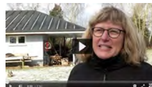
TV 2 / FYN var forbi det vandrende byting. Klik på billedet og se indslaget.