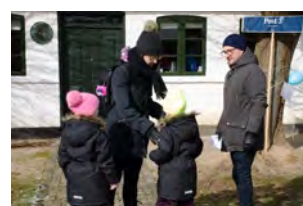
Mange lokale børnefamilier mødte op ved spejderhytten på Albanivej for at være med i 2. byting.