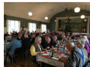
Der var fuldt hus til fællesspisning i Svanninge Sognegaard den 20. december 2017.

Læs mere om fællesspisning i Nr. Lyndelse og tilmeld dig her.