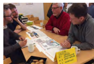
Der var et fint fremmøde ved bykontoret på Broby Friskole om områdefornyelsen af Nr. Broby og Brobyværk.