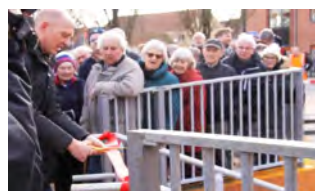
Borgmester Christian Thygesen klippede den røde snor til Ringe Station fredag den 3. marts.