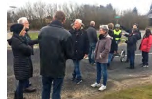
Afprøvningsworkshop 15. marts Se invitationen og tilmeld dig her .