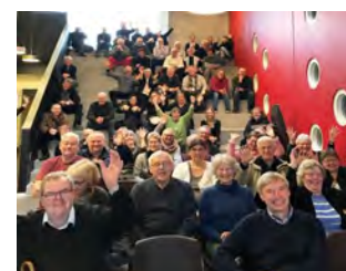
En fantastisk stemning med engagerede og idérige borgere prægede de to workshops i Nr. Broby og Brobyværk.