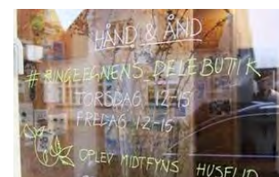
Er du nysgerrig på stillingen som bymægler i Ringe? Så se hele stillingsopslaget her .