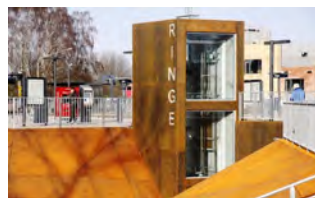
Materialerne i det nye stationsområde er inspireret af Ringe by og Jernstøberiet, der lukkede i udgangen af 2009.