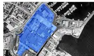
Den 30.000 m 2 store og centralt beliggende slagterigrund i Faaborg rummer stort potentiale.

Udover at være en god investering økonomisk og miljømæssigt, så er har bilerne blandt andet automatgear, der er med til at gøre medarbejdernes mange ture på vejene mere komfortable. Vi håber, I vil skænke vores miljø en tanke, når I fremover møder os på veje.