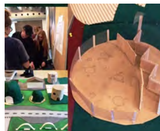
Du kan læse mere om de fremrykkede projekter i denne artikel fra TV2Fyn.