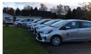
Glade medarbejdere klar til at køre ud til borgerne i nye hybridbiler.