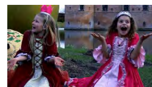
Se filmen 'Ønskelandets Drømmesdans', hvor elever fra Danse- og Teaterskolen Spektaklet danser Årets Dans rundt omkring i vores smukke kommune.