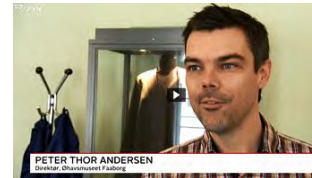
Se TV2 Fyns indslag om udstillingen Savn & Brand her .

Fredag den 28. april stimler 250 danseglade børn sammen i Carl Nielsen Hallen i Årslev for sammen at danse Årets Dans 'Ønskelandet'. Begivenheden er en kulmination på et forløb, hvor 2000 børn her i vores kommune og i Svendborg har lært dansen - og alle kan naturligvis danse med, når begivenheden live-streames på Youtube.