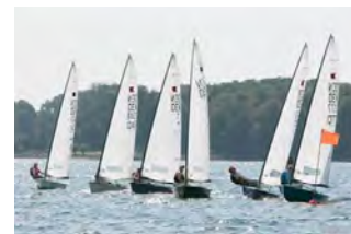
150 sejlere fra hele Europa indtager Øhavet ved DM i OK Jolle i Faaborg den 25.-29. juli.