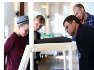
Et af elevernes designprodukter på Boltinggaard bliver studeret grundigt af de besøgende.

Læs også: " Undervisningsministeriet: En spændende måde at gøre det på " på Fyens.dk.