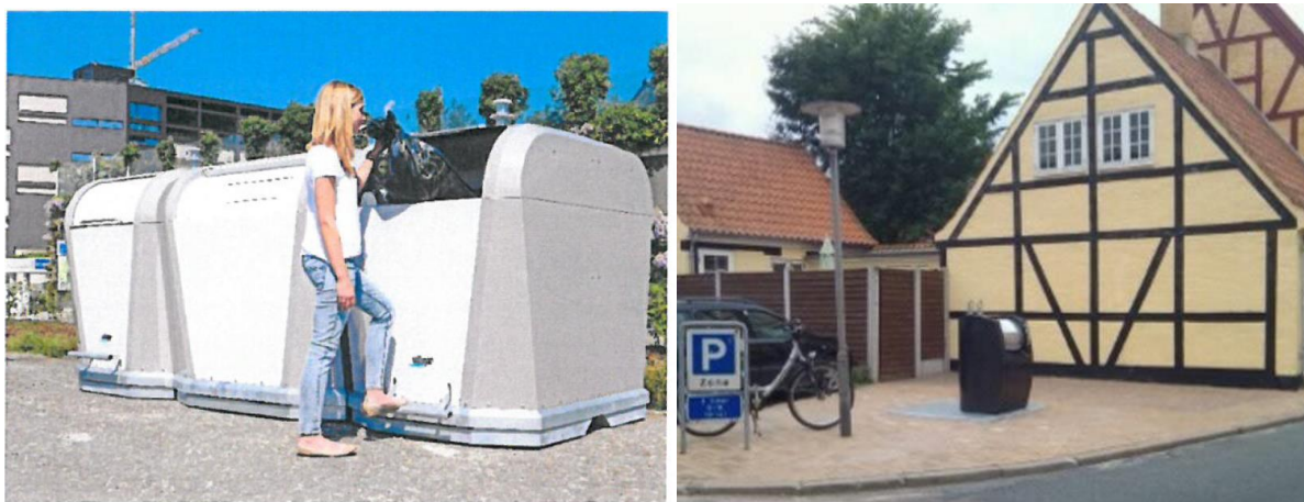
Figur 3. Illustration af en fælles overjordisk beholder som kunne placeres i Faaborg midtby. Og et billede af en nedgravet fællesbeholder vi allerede kender fra Faaborg midtby og som kunne placeres flere steder.

I en del af midtbyen er der allerede nedgravede fællesløsninger. Disse løsninger opdeles fra 2022 i to rum så restaffald og madaffald fremover kan sorteres for sig.