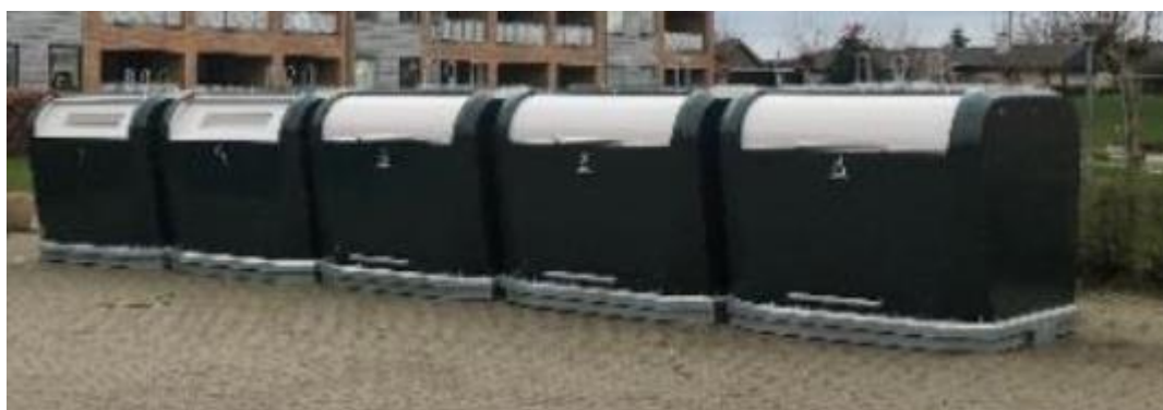
Figur 2. Illustration af de fælles løsninger som etableres i de større sommerhusområder.

Derfor overgår de større sommerhusområder til fælles sorteringsbeholdere som placeres centralt i områderne fx ved tilgangsvejen på en bedst egnet placering, der søges etableret i samråd med ejerforeningerne.