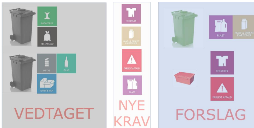
Figur 1. Den allerede vedtagne ordning med to 240 liters beholdere som leveres til husstandene i starten af 2022. På grund af nye lovkrav er det nødvendigt at indsamle yderligere fire typer af affald. Udfordringen løses ved at lade den nuværende beholder stå når de nye beholdere leveres i 2022. Den gamle beholder kan så bruges til indsamling af plast og drikkekartoner. Derudover er der forslag om en ordning for farligt affald og tekstil. Begge typer af affald kan samles i kasser, tekstil kan evt. indsamles i poser.

afsætningsmuligheder for brugt tekstil (udtjent tøj, gamle klude osv.) Indfasningen af denne del af ordningen er planmæssigt først i løbet af 2023. Tekstilaffald i form af tøj til direkte genbrug kan fortsat afleveres på genbrugsstationen.