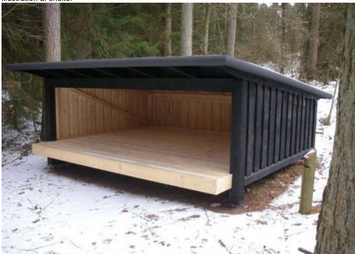
Illustration af shelter

Omtrentlig placering af de 4 shelters indtegnet af ansøger.