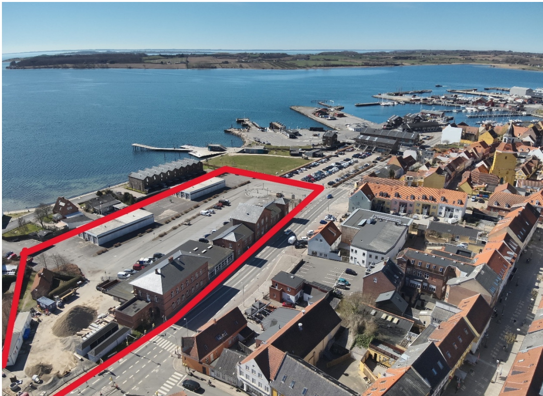
Oversigt over området