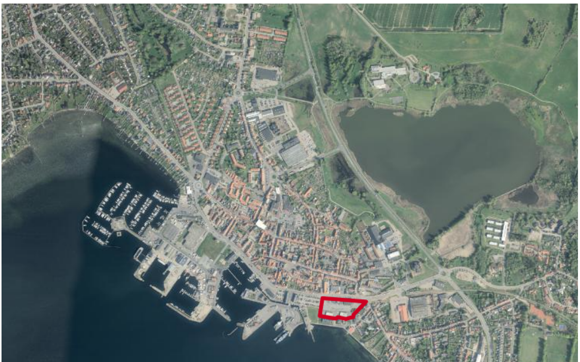
Kort over områdets placering i Faaborg.

Faaborg-Midtfyn Kommune udbyder hermed et samlet areal til nye etageboliger samt den tidligere stationsbygning og posthus i Faaborg til salg. Arealerne og de to bygninger udgør hovedparten af et meget attraktivt beliggende byomdannelsesområde lige ved vandet i centrum af Faaborg By.