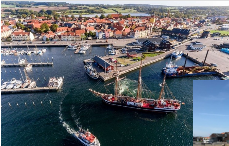
Luftfoto af Faaborg Havn samt Faaborg set fra Havnebadet