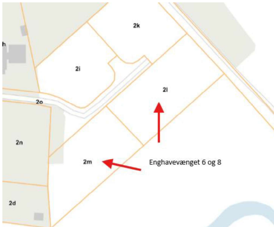
Figur 1: Enghavevænget 6 og 8, 5600 Faaborg.

Faaborg-Midtfyn Kommune har den 3. marts 2026 modtaget ansøgning om udledning af tag- og overfladevand i forbindelse med bebyggelse af hus og dertil tilhørende befæstede arealer på Enghavevænget 6 og 8, 5600 Faaborg. Huset har en størrelse på 297 m 2 . Udledningstilladelsen gælder for både Enghavevænget 6 og 8, 5600 Faaborg, da bygherre ejer begge matrikler.