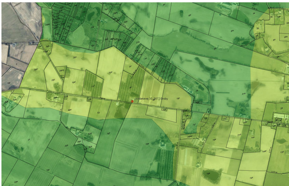
Kort med afgrænsning af beskyttet landskab (mørkegrøn skravering)

Masten placeres ca. 29 meter nordøst for maskinhuset på 60 m 2 og 50 meter fra beboelsen. Da masten placeres indenfor bestående haveanlæg, og lige udenfor beskyttet landskab, så vurderes masten ikke at påvirke landskabet væsentligt. Der stilles vilkår om, at den eksisterende beplantning mod det åbne land skal bibeholdes for afskærmning mod det åbne land.