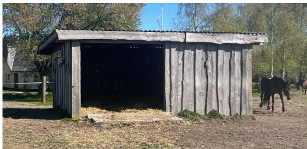
Illustration af læskur med overdækning