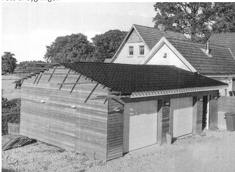
Foto af bygningen