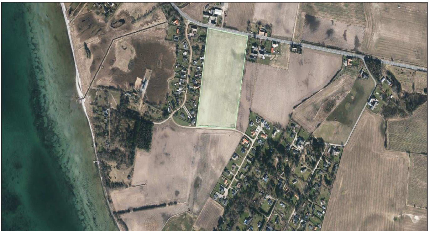
Kort over området

Aflysningen af rammen medfører ingen ændringer i den nuværende anvendelse, og der planlægges ikke nye anlæg. Det vurderes derfor, at aflysningen ikke vil påvirke yngle- eller rasteområder for Bilag IV-arter i området.