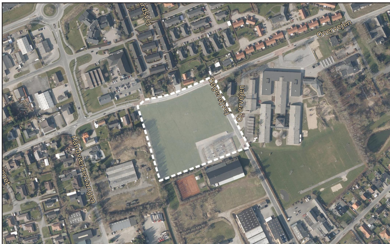
Afgrænsning af rammeområde.

Der er ikke fundet nogen konflikter i relation til at ændre parkeringsnormen for rammeområdet i forhold