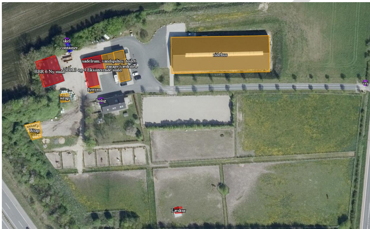
Figur 2.2: Oversigtskort over husdyrbrugets staldanlæg.

Alle stalde er med naturlig ventilation.