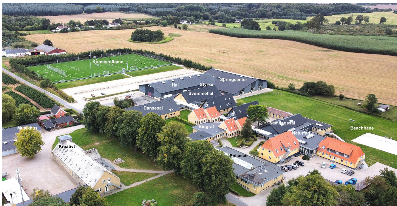
Dronefotografi af Bernstorffsminde Efterskole fra nordøst mod sydvest.

Matrikel 1c, Lydinge Gde., Brahetrolleborg er udpeget i Kommuneplan 2019 som særligt værdifuldt landbrugsjord. Det vurderes, at efterskolens interesser vægter højere på arealet end landbrugsinteresserne.